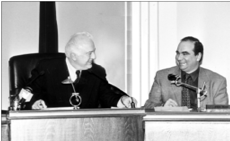
Обсуждение мероприятий по обеспечению и координации

ЭДУАРД ШЕВАРДНАДZE НЕОБХОДИМО НАЧАТЬ СЕРЬЕЗНЫЙ ПОВОРОТ ИСТОТНИТЕЛЬНОВЛАСТИ ЗАКОНОТВОРЧЕСКОЙ ДЕЯТЕЛЬНОСТИ'