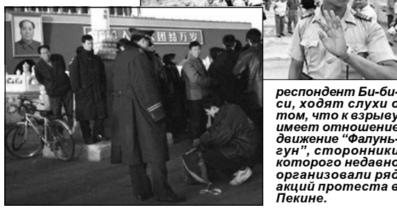
респондент Би-би-си, ходят слухи о том, что к взрыву имеет отношение движение «Фалуньгун», сторонник которого недавно организовал ряд акций протеста в Пекине.

нии сказано, что жертвой взрыва стал сам террорист, один прохожий ранен. Как подчеркивает кор-