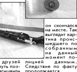
он скончался на месте. Так выглядит картина происшедшего по сформанным на данный момент данным. Следствие по факту продолжается.

ти, те отказались. Тогда он вошел в дом и спустя некоторое время появился с автоматом и охотничьим ружьем для того, что-