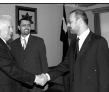
лучивающей внимания. По его решению представители исполнительной и законодательной власти совместно обсудят этот вопрос.

уже несколько крупных фирм по производству сигарет заинтересовались в выпуске своей продукции на этой фабрике. Учитывая, что более эффективна борьба с контрабандой не административными методами, а именно развитием собственного производства, Президент Грузии призвал инициативу представителей компании зас-