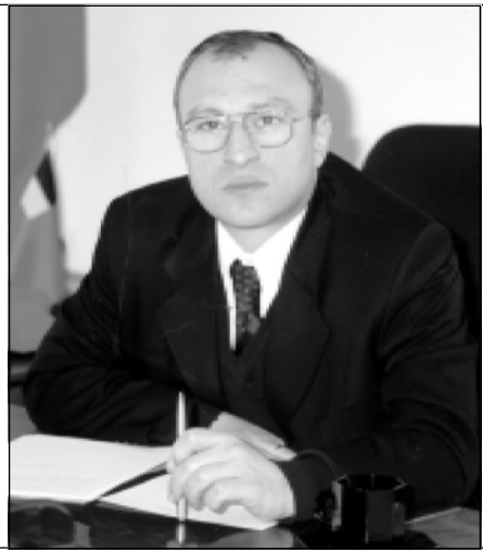
Тебо ИСАКАДЗЕ, заместитель Государственного министра Грузии

не являются самоцелью. В Грузии задачами социального реформирования определено формирование прочных социальных гарантий для человека со дня его рождения и до самой смерти. Поэтому важно с самого начала выбрать верное стратегическое направление, ведущее к развернутой системе социального страхования. В новой Грузии, с экономической, опирающейся на рыночные социально-ориентированные отношения, эти гарантии населения должны давать такие классические страховые принципы, как солидарность поколений, справедливость, целенаправленность, обеспечение социальной достаточности, эффективность и платежеспособность.