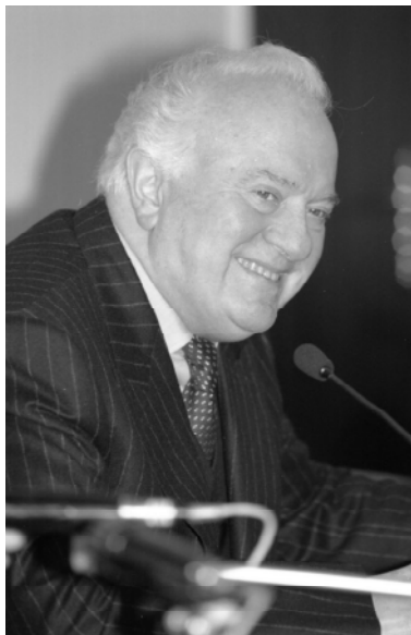
21 февраля Президент Грузии Эдуард Шеварднадзе провел брифинг и ответил на вопросы журналистов

- Как Вы оцениваете выдвижение Джумбера Паташвили кандидатом в Президенты Грузии? - Я уже отвечал на подобный вопрос, заявив, что для меня такое развитие событий не было неожиданным. - Вы не собираетесь съездить в Батуми? - Собираюсь. Завтра или послезавтра. - Вы не ожидаете, что после Вашего приезда в Батуми Аслан Абашидзе заявит о снятии своей кандида-