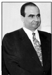
Вчера председатель Парламента Грузии Зураб Жваниа

ния принял руководителя Миссии наблюдателей Бюро демократических институтов и защиты прав человека ОБСЕ Николая Вучанова. Как заявил господин Вучанов на встрече с Зурабом Жваниа, только ОБСЕ направит на президентские выборы в Грузии до 150 наблюдателей. 20 наблюдателей посетят Грузию на более длительный срок и изучат ход всей предвыборной