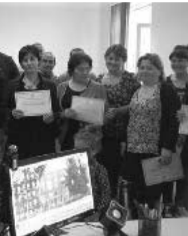
ქედის ბაგმბეზალი ორბანიძის „ქონსორციუმის“ წარმომადგენლებს შეხვდა

სახალხო ზეიმს შეუერთდნენ „საქართველოს ქალები მშვიდობისა და სიცოცხლისათვის“, საქველმოქმედო ფონდი „ავერსი“, საწარმოები „ბარამო“ და „ზედაზენი“, ახალგორისა და ქარელის ქალთა საბჭოები.