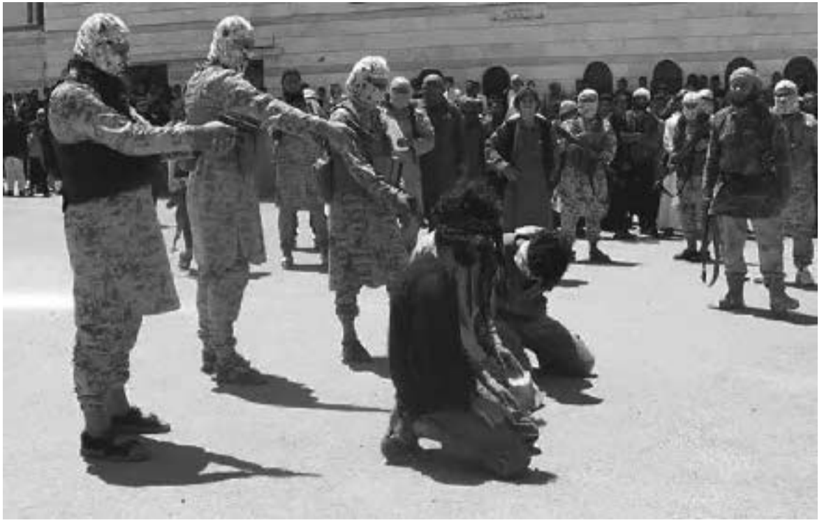
აზანზარებენ და აფრთხობენ და ეს საშიშროება რეალურია.

რუსეთის აგრესია, რაც შემთხვევითი როდია. „კვბეს“, მის მემკვიდრე „ფსბ“-ს და სხვა სახელმწიფო სტრუქტურებს ჯერ კიდევ საბჭოთა დროიდან აქვთ ანტი-ამერიკული, ანტიდემოკრატიული და ისლამური ტერორისტული ორგანიზაციების შექმნის, დაფინანსების, შეიარაღების და სხვა მხრივ მხარდაჭერის გამოცდილება, არსებობს საიდუმლო „მასალა“, რომლის შესყიდვა და გამოყენება შესაძლებელია, რადგან ისინი მინიმალურად არიან დაკავშირებული იმ რგოლებთან, რომლებსაც საკუთარი სურვილისამებრ განკარგავენ, ხოლო თავად რგოლებმა მათი არც არსებობა იციან და საერთოდ არც არაფერი. ამიტომ, ძნელი დასადგენია, ვის მიერ არიან მხარდაჭერილები, ვინ განკარგავთ და ვის დავალებას ასრულებენ, საიდან მოსდით დაფინანსება და ზოგადად ვის თამაშს თამაშობენ, მაგრამ ამ ბოლო დროს არის მოსაზრება, რომ ეს ბოლო სახელის გადარქმევა გან-