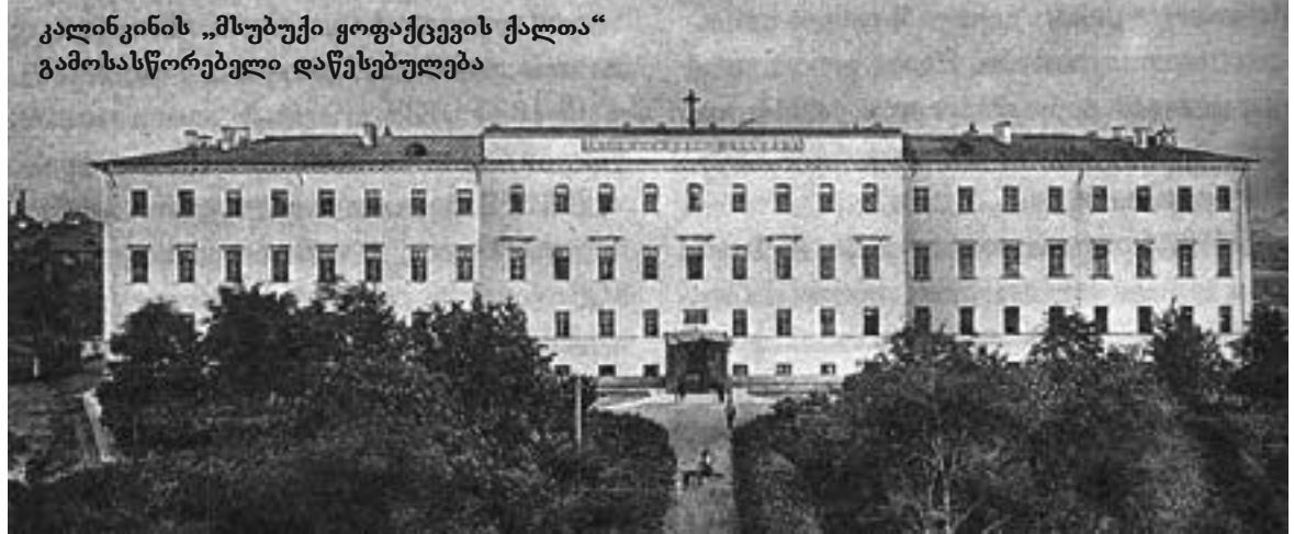
კალინკინის „მსუბუქი ყოფაქცევის ქალთა“ გამოსასწორებელი დაწესებულება

ანი რკინის რგოლები“ ეკეთათ. ბევრმა პატიმარმა სიცოცხლე ამ საპატიმროში დაასრულა. პრინციპულად ახალი ეპოქა კალინკინის სახლისთვის ეკატერინე II-ის მმართველობის დროს დადგა. 1779 წელს ეს დაწესებულება გამოსასწორებელი უწყების სტატუსს კარგავს და ხდება „ფრანგული დაავადებების“ საიდუმლო სამკურნალო — რუსეთში პირველი ვენერიული დაავადებების სამკურნალო კლინიკა. მკურნალობა ანონიმური იყო, გარეშე პირებს ტერიტორიაზე არ უშვებდნენ, ხოლო პაციენტებს შეეძლოთ კონსპირაციის მიზნით ნიღბები ეტარებინათ. ახლა უკვე გარყვნილ ქალებს აქ აღარ სცემდნენ, არც