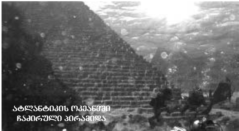
ატლანტიკის ოკეანეში ჩაძირული პირამიდა

ჩინელი არქეოლოგი ამბობს, რომ პირამიდები განლაგებულია ასტრონომიული ასპექტების გათვალისწინებით და წარმოადგენს გეომეტრიისა და მათემატიკის გასაოცარი ცოდნის ნიმუშს, მხოლოდ ის არის გასარკვევი, საიდან ჰქონდათ ძველ ადამიანებს ასეთი ცოდნა. მკვლევართა ვერსიების მიხედვით, ეს არის „ნათელი ზოლების“ გეგანტური სისტემის ნაწილი, რომელსაც ჩინეთში „ფენ-შის“ უწოდებენ.