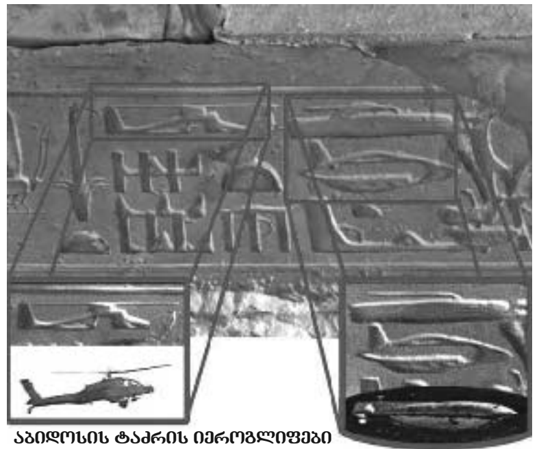
აბილონის ტაძრის იმრობლივები

(სხვათაშორის, ტეოტიუაკანი თარგმანით ნიშნავს „ადგილს, სადაც ღმერთები დედამიწას შე-