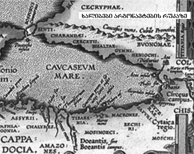
ხალიბები არაბონავტების რუკაზე

მოვიდნენ. ამ ცნობების მიხედვით, ისინი ძირითად კოლხურ ტომებთან (ტიბარელები, მოსინიკები, მაკრონები, მაკროკეფალები და სხვა) გარემოცვაში იხსენიებიან. აღსანიშნავია, რომ VII ს. სომხური „გეოგრაფია“ ხალიბებს კოლხურ ტომ ჭანებთან აიგივებს.