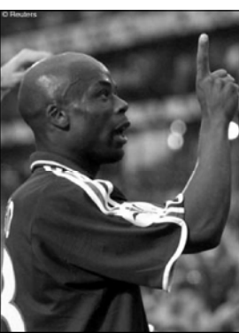
моментах у итальянских ворот в последние четверть часа. Меня много критиковали, но я решил сделать ставку на чемпионов мира. Сейчас, как вы

Тренер сборной Франции Роже Лемерр: «Настоящая игра началась после первого гола. Благодаря нашей воле мы все-таки победили, хотя команда Дино Дзоффа доставила нам много проблем, даже больше, чем голландцам в полуфинале. Перед матчем, словно предвидя это, я говорил, что если останется последняя секунда, надо будет играть, сохраняя надежду. Когда надежда умерла, спасти нас могло только чудо. Закономерное чудо, учитывая количество