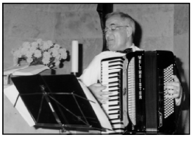
В Евангелиско-лютеранской церкви Примирения в Тбилиси состоялся концерт...

Кавказе. Быть может, самым ослепительным. Во всяком случае те, кому довелось быть свидетелем блестящего музыканта, навсегда остаются восторженными поклонниками его игры.