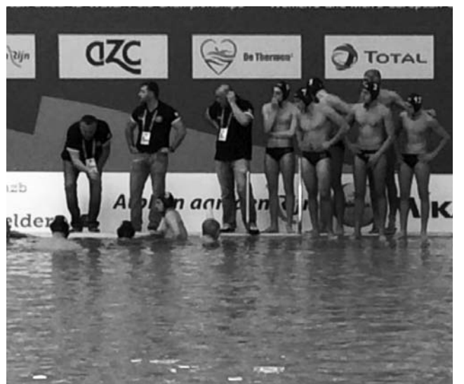
რუბრიკა მოამზადა ირაკლი თაყაიძემ

ახლა ჩვენებს გასამართი დარჩათ ჯგუფის ბოლო შეხვედრა რუსეთთან. დებულებით, ჯგუფის გამარჯვებულები მეოთხედ-ფინალში ავტომატურად გადიან, დანარჩენები კი პლეი ოფში დაწყვილდებიან. ჩვენი ჯგუფის მეტოქე D ჯგუფის წარმომადგენლები იქნებიან, სადაც საბერძნეთი, უნგრეთი, ჩერნოგორია და მალტა მოხვდნენ. იმათგანაც პლეი ოფში მალტა თუ გვერგება, თორემ სხვებთან შანსი, ფაქტობრივად, არ გვაქვს.