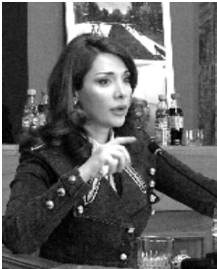
მსჯავრდებულებს მაგისტოფონებისა და სათიხის გამოყენების უფლება აღარ ქმნებათ.

სასჯელადსრულელების, პრობაციისა და იურიდიული დახმარების მინისტრის ბრძანებით შეიძლება ჩამოიხილოს იმ პირების მიხმარების საგნების, პიგინური საშუალებების, სხვა ნივთებისა და საგნების, რომლებიც მსჯავრდებულს უფლება აქვს ახანაის სახით მიიღოს, შეინახოს, განიხიროდ გამოიყენოს ან შეიძინოს მალაზიაში.