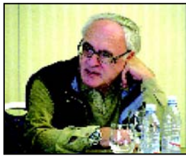
რა ჩაიფიქრა მმართველმა გუნდმა