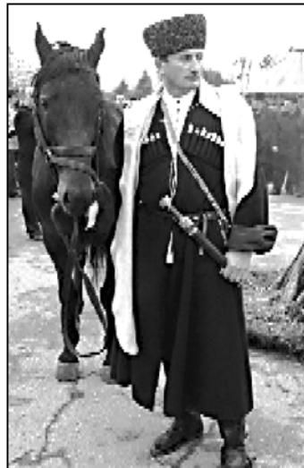
მისმა განცხადებამ, შესაძლოა მათზე გარკვეული გავლენა იქონიოს.

მოვიდა. ჩვენებურებს „აბაძროს“ ექს-მეთაურის ბოლო მოსაზრებებიც მოეწონათ. იაგანოვის ბოლო განცხადებებიც საკმაოდ მნიშვნელოვანია. აფხაზეთისთვის ის ისევე დიდი ავტორიტეტია და