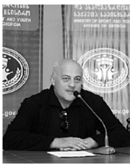
სო საბჭომ 2006 წლიდან „ერთი თასი“ დააწესა, მაგრამ ბოლო თანხა წელიწადში, განსაკუთრებით კი 2011 წლის მსოფლიო თასის გათამაშებაში „ერთი“ 2-ის ქვეყნის პროგრესი ნათელია გამოჩინდა. ახალი ტურისტული „მეორე ევროპის“ პროექტს გუნდის წევრებს და სათანადო ოსტატობის დაბეჭდვის შესაძლებლობის შესახებ.

7-9 თებერვალს „მეორე ევროპის“ სარაგობი კავშირების ხელშეწყობით ლას ვეგასში შეიკრიბნენ და 2013-16 წლებში გასართობი ახალი ტურისტული მსახურის დასრულება შეეხებოდა. მსახურის დასრულება შეეხებოდა.