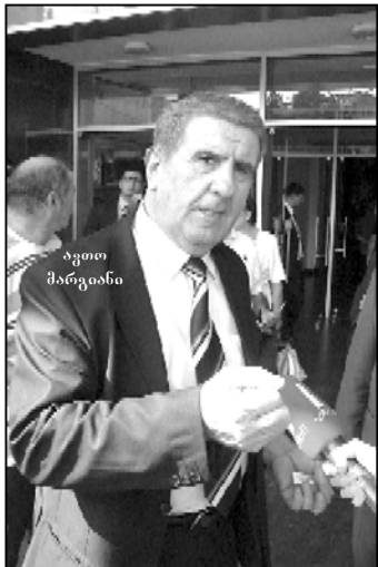
საცემრად გავიციე, მაგრამ ვერ მოვახერხე. — რატომ ვერ მოახერხეთ? — სასწრაფოდ წაიყვანეს იქიდან. მაგრამ