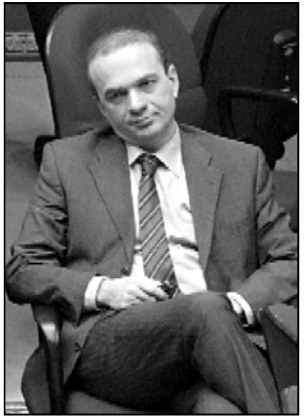
შოთა გალაშხია, გადაბარება არ გსურთ?

რუსეთის ბანაკი გადაბარება რას ნიშნავს? რუსეთი თითონ არ არის რუსეთის ბანაკი. არის რუსეთი, რომელსაც საბჭოთა კავშირისგან მივაყვამ, რაც განსწავლდა და ამ დღის მომხრე პოლიტიკური სექტორი აქვს აქ, რომელსაც აფინანსებს. ამ მერე კოლონის შანსი, რომ ისინი მოიგებენ არჩევნებს, ნულის ტოლია. რაც შეეხება საქართველოს ხელისუფლებას, მისი პოზიცია არის ევროკავშირი, ნაწილს, ტერიტორიების დეოკუპაცია და პარტიულად ურთიერთობა აშშ-სთან. ეს არის უცვლელი პოზიცია და, თუ რუსეთი შეეცდნება და ევროკავშირში, ეს ჩვენივე ძალიან მისაღები ფაქტი იქნება.