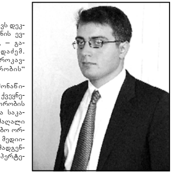
გარეშე არ არსებობს. ჩვენ გაექვს დემოკრატიული პოლიტიკა ქვეყნის ევროკავშირთან ინტეგრაციასთან. — განაცხადა სასტუმრო „რედისონში“ „ევროკავშირ-აღმოსავლეთი პარტიზირის“ პირველი ფორუმი გაიხსნა. ფორუმის მუშაობაში მონაწილეობენ ევროკავშირის წევრი ქვეყნებისა და აღმოსავლეთ პარტიზირის ქვეყნების აღმასრულებელი და საკანონმდებლო ხელისუფლების მაღალი რანგის წევრები, არასამთავრობო ორგანიზაციები, საერთაშორისო მედიასა და ბიზნესრეგების წარმომადგენლები და დამოუკიდებელი ანალიტიკოსები.

ტეგრაცია ქვეყნებს შორის ღრმადებული და ეს მნიშვნელოვანია. დარწმუნებული ვარ, გაფართოება გააძლიერებს როგორც ევროს, ისე ევროკავშირს, — განაცხადა თორნიკე გორაძემ. საგარეო საქმეთა მინისტრის მოადგილემ ისაუბრა ასევე რუსეთ-საბერძნეთის ურთიერთობებზე და აღნიშნა, რომ საქართველო ცოცხა ხნის წინ ომი გადართავდა, რომლის მიზანი იყო საქართველოს მოწყვეტა თავის ევროკავშირ ფუქსიან. — იყო მცდელობა, შეგნებულყო საკართველოს ინტეგრაცია ევროკავშირთან. ჩვენ ვინციბებთ, რომ დემოკრატია სტაბილურობის გარანტია და ეს ორი ცნება ერთმანეთს