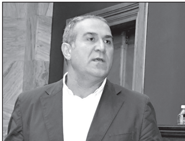
ნიკლაური: კარგია, მეტ ყურადღებას თუ მოგვაქცევ,

– მან განაცხადა, რომ ნაციონალები რამეს თუ დააპირებენ, ხალხი აღარ მოითმენს. ეს უკვე მიუთითებს იმაზე, რომ ხელისუფლებაც ინფორმირებულია. იმ შემთხვევაში, თუ „ქართული ოცნება“ ნაციონალებს არეულობის მოწყობის უფლებას მისცემს, ხალხი ორივეს გადაუღლის, – ვარაუდობს უფლებადამცველი.