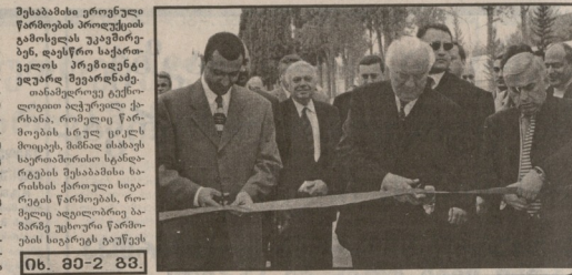
თბილისში ახლად ამოქმედდება თბილისის ფარმაცეპიკალი... საქართველოს ბაზარზე პირველობას აპირებს „პირველი“...