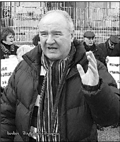
„ამ არჩევნებში ხელისუფლებას 3 მილიარდი დასჭირდება“

— გამორიცხავთ, რომ მმართველმა პარტიამ საპარლამენტო სიაში ივანე ცაგარეას თვითმმართველობის აქტიური წევრები ან ლიდერები შეიყვანა? — რამდენიმე შემთხვევაში, დავუშვავ, 10 ახალგაზრდა. შესაძლოა ეს არის საცდელი. შეიძლება 25 კაცი გახალდეტუბი, რომელიც 21-დან 25 წლამდეა. ამით სხვა ახალგაზრდებს მისცეს სტიმული, რომ შაშინა ვერ მათს და მოდი, ამ სისხლანი რეჟიმს მზარს მაინც დაუეჭვრ. ეს ყველაფერი მხოლოდ ამ ყალბ პიარკამპანიას ემსახურება, რაც ახალს აქვერადგან გზადვით. ჩვენ ამ ხელისუფლებას არაფერი გაგვიკრძალა, არც ის, რომ დეპუტატის ასაკი 18 წლამდე