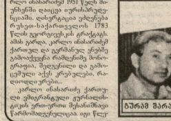
პროფ. ვინსენტი ბარბატი