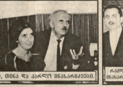
პროფ. ვინსენტი ბარბატი