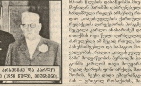
პროფ. ვინსენტი ბარბატი