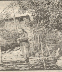
სახელობის ეკლესია ყოფილა...