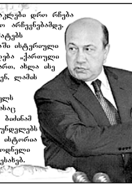
რაც უფრო ნაკლები დრო ნრება საპარლამენტო არჩევნებამდე...

მა უკვე კარგად ვიცნობ, ვიცი, რა არის ზოგადად ნებისმიერი იმპერია, ეს მომაკვდინებელი და გაუკუღმარებელი აზროვნების კერძოაფიანისმცემლობის გამოვლინებაა, ნაცვების იდეოლოგიას საერთო არაფერი აქვს არც დემოკრატიასთან და არც პარტიოტიზმთან, მიზნში ისეთივე სახიფათოა, როგორც კომუნისტური ლტინიზმი და ნებისმიერი სხვა იმპერია. კოტე ჯანდიერმა ზუსტად განსაზღვრა, რომ სააკაშვილს არ გააჩნია იდეოლოგია, მთელი მისი იდეოლოგია — ეს არის „შუშუ-ლუდვიგ ძალაუფლებების მანიპულაციური მეთოდები“. სწორედ ამის გამოვლინებაა ისტორიული კვილე-ნოვილი და შემოებზე, კუდიან დედაბრებსა და ჩარეცხილულზე ნადირობა, რაც უფრო ძლიერდება სააკაშვილის ისტორია, მით უფრო ინარჩუნებს ივანიშვილი სიმშვიდეს, მისი უპირატესობა სააკაშვილზე სწორედ სიმშვიდეშია, კარგი იქნება, თუკი ივანიშვილი სიმშვიდეს ბოლომდე შეინარჩუნებს, რადგან ისტორია, ყვირილი და თვალების ბრიალი ამომრჩეველს უკვე ბოძებულა. თავის დროზე ქარიზმატულ ლიდერად შერაცხულ