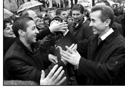
ინოღებოღებს, - აღნიშნა ივანიშვილმა.

ის, რომ დღეს ჩვენი პრეზიდენტი ტრაბახობს, სახელმწიფო არ არსებობდა და მან შექმნა, მართო ეს ერთი ატრიაბუტი, მხოლოდ დამოკიდებულება თქვენდამი საკმარისი იმისათვის, რომ ამ სახელმწიფოს სახელმწიფო არ შეიძლება ერთობის. სახელმწიფო, რომელიც უარს ამბობს თქვენნიარ ადამიანებზე, ის არ შეიძლება, სახელმწიფოდ