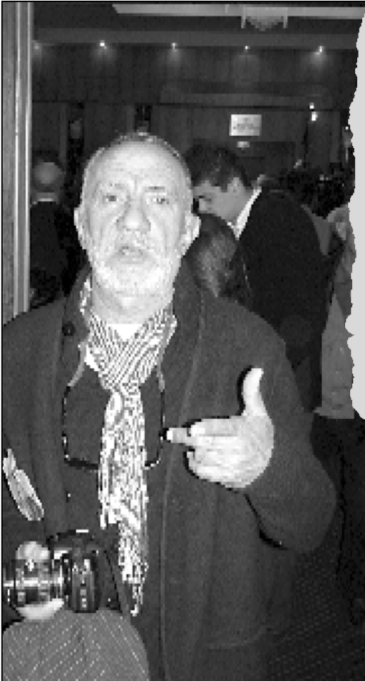
— მაგრამ დონალდ ტრამპი ჩამოიდა...

— სახელის თვალსაზრისით, რა თქმა უნდა. პოლიტიკა და ეკონომიკა ერთმანეთთან ისეა გადაჯვავებული, ფინანსური სრუები იმხელა გაუღუნებს ახდენენ პოლიტიკაზე, რომ დარჩინებული ფინანსური პოლიტიკოსობა ამას ნამდვილად არ სჭირდება. ბუნებრივია, ეს ყველაფერი ერთმანეთზეა გადაჯვავებული. ამიტომის ადამიანი, რომელსაც ძალიან კარგი და მყარი სახელი აქვს მსოფლიო ფინანსურ სრუებში, ბუნებრივია, მას არანაკლები მხარდაჭერა ექნება პოლიტიკურ სრუებშიც, რადგან ერთი მხრივ დასამუშავებელი არის. ყველას კარგად ესმის, თუნდაც ამერიკის შეერთებულ შტატებში, რამდენად არის დამოკიდებული პოლიტიკური წარმატება ფინანსურ სამყაროში ადამიანის სახელზე, წარსულზე, კეთილსინდისიერებაზე, ბიოგრაფიის გამჭვირვალობასთან. მე ვფიქრობ, კეთილსინდისიერებით ბიზნესმენი ბიძინა ივანიშვილი ერთ-ერთ