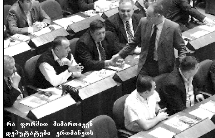
რა ფორმით მიმართავენ დეპუტატები ერთმანეთს

პარლამენტში მოსახვედრად ჩვენი პოლიტიკოსები თავიანთს იმტკიცებენ. ზოგჯერ ამ მიზნის მისაღწევად სხვებსაც ულაშაზებენ სიფათს, მაგრამ საკმარისია მოხდნენ პარლამენტში, რომ მერე სდომობა დარბაზში ფაქტიურად აღარ