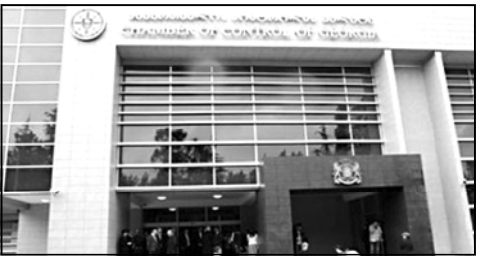
მას კონსტროლის პალატის ქუთაისის, ბათუმისა და თბილისის ოფისებში მიიწვიეს მოქალაქეები, რომელთაც აქვე საიჯარო და სამენარეგო ურთიერთობები პოლიტიკურ სუბიექტთან, რათა კონსტროლის პალატაში მიიღონ აუდიტორული რწმუნება მათი უსაფრთხო საქმიანობის კანონმდებლობის შესახებ.

– მოქალაქეთა პოლიტიკური გაერთიანებების შესახებ“ კანონის საფუძველზე კონსტროლის პალატის პოლიტიკური პარტიების ფინანსური მონიტორინგის სამსახური საზოგადოებრივი მიმართება „ქართული ოცნების“ კოალიციას და მასში შემავალი სუბიექტების მიერ იჯარით აღებული ფართობის მონაწილესა გაწვეული ხარჯების კანონიერების შემოწმებას ახორციელებს, კანონიდან არსებობს შეკრებაში გაწვეული საქმიანობისა და ფინანსური აღრიცხვა-ანგარიშგება შორის, – აცხადებენ კონსტროლის პალატაში. უწყებებმა განმარტავენ, რომ ამ მიზნით 2