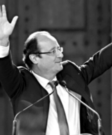
კოლა სარკოზის ადმინისტრაცია ავრცელებს.

საფრანგეთში გამართულ საპრევიზიონო არჩევნების მეორე ტურში სოციალისტმა ფრანსუა ოლანდმა გამარჯვება.