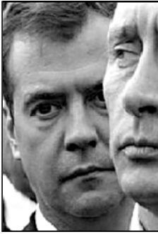
ნიალი ერემული გამომართა.

რეშე სხდომაზე ხვალ გაიტანენ. იქამდე კი პრევიზიონის კანდიდატი სათათბიროს ყველა დრეჟიციასთან კონსულტაციებს გაართავს.