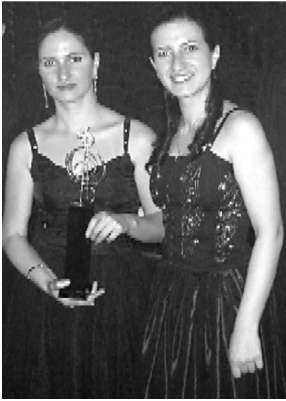
ში ჩემმა გოგონებმა დაუკრან მათ ქვეყნებში.

— ვინ იყვნენ ჟიურის წევრები? — ფიროზი ცხობილი ადამიანი იყვნენ როგორც საქართველოდან, ასევე ამერიკიდან, საფრანგეთიდან, ლატვიიდან, ესტონეთიდან, სომხეთიდან. იმით არ ვაქტვ, რომ ჩემი შვილები არიან, მაგრამ ფესტივალის დახურვაზე ყველა ამბობდა, მაგრამ დაუკრესო. მართლა მაგარი იყო ტექნიკურადაც და ტექნიკაშიც. მანამდე ვსულ უკრავდნენ დუეტში, მაგრამ კონკურსზე არასოდეს გასულიყვნენ. ბევრი კონკურსი ვიცი, მაგრამ სპონსორი არ გვაყავს და ვერ ჩავდივართ ხოლმე.