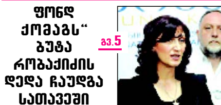
— აპ. 2 —