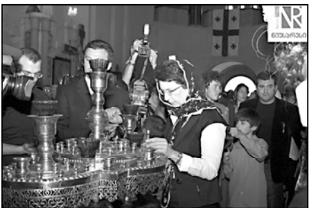
მისი თქმით, ივანიშვილის მხრიდან დიდი შეცდომა იქნებოდა, რომ მან ნაბიჯი არ გადადგა და გასაკვირი არ არის, რომ მან სწორი გადაწყვეტილება მიიღო.

„დემოკრატიული მოძრაობა“ ერთიანი საქართველოს ლიდერი ნინო ბურჯანაძე კოალიცია „ქართული ოცნების“ ლიდერ ბიძინა ივანიშვილის მიერ სამაგალი მიხვლის გადამწყვეტილებას პოზიტიურად აუხსავს.