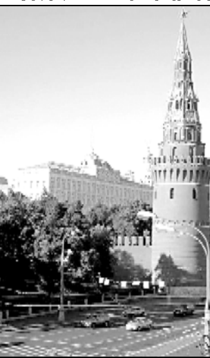
შორის 23-მა სახელმწიფომ, ასევე აშშ-მ, ავსტრალიამ და კიდევ მრავალმა ქვეყანამ აღიარა, ის სრულფასოვანი სახელმწიფო მაინც არ არის.

ექსპერტის თქმით, სამხრეთ ოსეთის, აფხაზეთისა და კოსოვოს შორის ბევრი პოლიტიკური, ისტორიული და ეთნიკური განმასხვავებელი ნიშნია. მისი განმარტებით, მიუხედავად იმისა, რომ კოსოვო ევროკავშირშია.