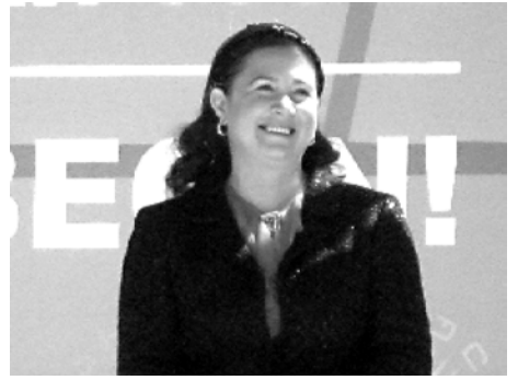
გამარჯვებით დავასრულებთ, იმიტომ რომ მუხტი უფრო და უფრო გაიზარდება და მიელ საქართველოს გადავებთ, – დაძინა აბაშიძემ.

– აქედან გამომდინარე, ოქტომბერში ჩვენ ამ ბრძოლას