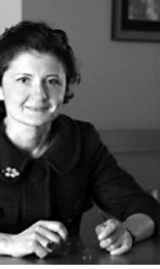
ლის პალატის მონიტორინგის სამსახურის ბოლოდროინდელი უკანონო ქმედებები. ზნაოლის ფაქტები, რომელიც კოალიციის აქტივისტებსა და წევრებს ხორცილებდა. დაუსრულებელი კითხვები და გაუგებრობა ფარსეგობის, რომელსაც მონიტორინგის სამსახური გამოიწვიებდა კარტებს. სახელმწიფო მდიანის თქმით, არჩევნების დემოკრატიული ჩატარებისთვის წინასწარჩევი კამპანიის სწორად წარმართვა აუცილებელია. — აღნიშნა პრესკონფერენციაზე წულუკიანი.