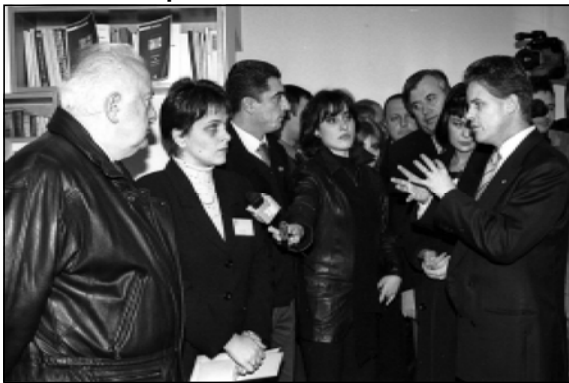
Министр труда, здравоохранения и социальной защиты Грузии Автандил Джорбенадзе (слева) и представители международных организаций в Национальном центре по борьбе с туберкулезом.

Окончание. Министр труда, здравоохранения и социальной защиты Грузии Автандил Джорбенадзе заявил, что в борьбе с распространением в нашей стране недугов и опасным заболеванием - туберкулезом особую помощь грузинским коллегам оказывают соответствующие организации Германии, Соединенных Штатов Америки. Ученые нашей страны интегрированы с международными научными кругами, а при финансировании правительства Соединенных Штатов Америки в этой сфере осуществлен ряд интересных исследований. То, что полноценная реализация Национальной программы по борьбе с туберкулезом в стране - действительно один из важных приоритетов, подтверждает и тот факт, что в бюджете на будущий год для преодоления этого недуга предусмотрено 3,5 миллиона лари. "Борьба с туберкулезом - один из важных приоритетов. С 2001 года в нашей стране начнется новый этап искоренения этой болезни, что, бесспорно, станет еще одним ярким примером осуществления направленной Президентской программы Эдуарда Шеварнадзе", - заявил Автандил Джорбенадзе. Министр выразил благодарность представителям всех организаций, которые заверяют в поддержке сотрудников Национального центра по борьбе с туберкулезом. Он особо подчеркнул уси-