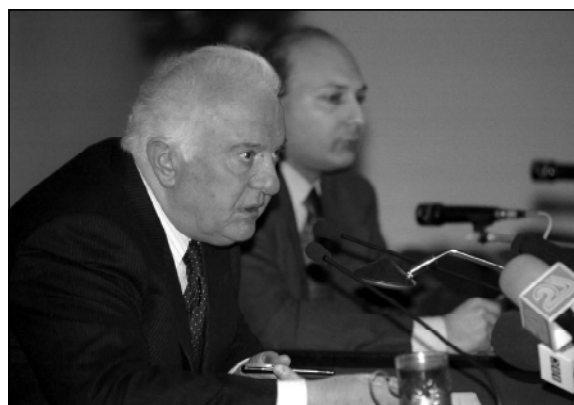
Какой знак протеста против принятия руководством России решения о введении визового режима...

- Обсуждали ли вы эти вопросы с Владимиром Путиным? Есть неподтвержденные слухи, что вы можете отказаться от поездки в Минск, на