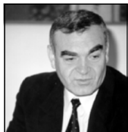
Вчера в Москве состоялась встреча правительственной делегации Грузии с премьер-министром Российской Федерации Михаилом Касьяновым и вице-премьером Виктором Христенко. Как сообщил в телефонном разговоре из Москвы Государственный министр Георгий Арсенишвили, главной темой встреч было снабжение Грузии энергоресурсами из России, в частности, природным газом и электроэнергией.