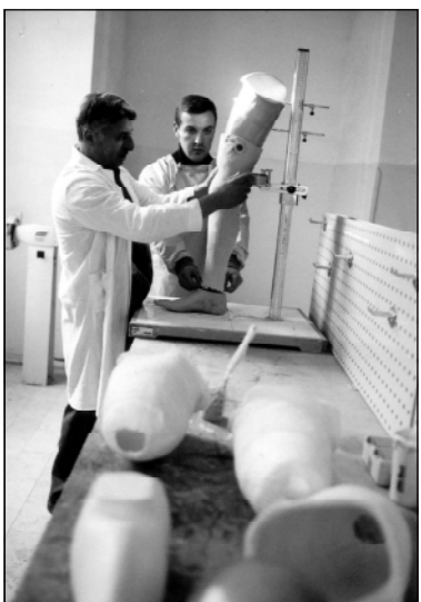
ортопедические туфли, биопротезы, специальные бандажи при различных заболеваниях...