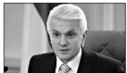
სტრანტებისათვის მოქმედების კოორდინირებაში ხელის შემშლად. დეპუტატმა ასევე დაამატა, რომ ხელისუფლებამ ამ გზით მომიტინგეების სწრაფად დაშლას გეგმავს, ვინაიდან ისინი საკუთარ ნაყოფსა და ახლობლებს ვეღარ უკავშირდებიან.

შეგახსენებთ, რომ უკრაინულ სახლთან, 3 ივლისიდან მოყოლებული, ენის შესახებ კანონს აპროტესტებენ, სადაც ყოველ საღამოს ასობით ადამიანი იკრიბება. ასევე ცნობილი გახდა, რომ აქვენი უკრაინა-სახლთა თავდაცვის“ დეპუტატმა იგორ პალიცმა უმაღლეს რადაში „სახელმწიფო ენის აუცილებლად დღისთვისა და გამოყენების“ 10700 კანონპროექტი დაარეგისტრირა. კანონპროექტის თანახმად, თანამდებობის პირი აუცილებლად უნდა ფლობდეს სახელმწიფო ენას და სამსახურებრივი მოვალეობის შესრულების დროს გამოიყენებდეს. განმარტებით ჩანაწერში საუბარია, რომ აღნიშნულ ადამიანს სამსახურში მიღებაზე დიდი მნიშვნელობა აქვს მისთვის, ამ კანონის დარღვევის გამო კი თანამდებობის პირი სამსახურში გათავისუფლებდა. კანონპროექტი თავდაპირველად ენის, სახელმწიფო-სა და სამართლის ინსტიტუტებში მოსმინეს და მოწინეს. კანონპროექტის თანახმად, უკრაინული ენის ცოდნა გამოიყენების გზით შემოწმდება. ამასთან, გუშინ ვლადიმერ ოგრიზკომ განაცხადა, რომ სახელმწიფო ენაში უკრაინულ ნეგრობის წვეტება და ოგრიზკომ საკუთარი გადაწყვეტილება უკრაინაში ახალი ეროვნულ-პოლიტიკური პარტიის შექმნის აუცილებლობა აღსანიშნავია, რომელიც საზოგადოების მოთხოვნებს განახორციელებს. მისი მტკიცებით, „ნაშა უკრაინა“ ამ საქმეს ვეღარ უჭლებს.