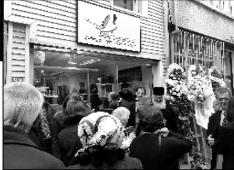
ერთი ქართველს გაჰყავა, მეორე კი — თურქს, მაგრამ ბევრ ქართველს სჯობს.