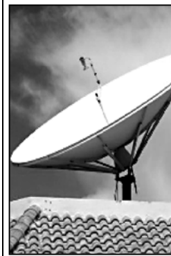
მაც - ახდებენ ორგანიზაციაში.

„როდესაც ლილის ბაზრობაზე გასულხდა სურვილი გამოთქვით, 15 საბავლიტარი ანტენა და მიმდები გვეყავა, ერთ-ერთმა გამოივლდა გვიანახს, რომ ანტენების ამდერი საზოგადოება არ ჰქონდა. იგივე პასუხით გამოვიტესტურეს სხვა გამოივლდები.