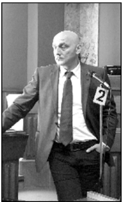
ბალთურიკა დარწმუნებულია, რომ შეთანხმება აუცილებლად შედგება.

მისი თქმით, ეს პროცესი ცალკე იმეორდება, „ქართული დასი“ მანაც გააგრძელებს თანამშრომლობას, რადგან მოახლოებულ არჩევნებს ქვეყნის მომავლისთვის გადამწყვეტი მნიშვნელობა აქვს.