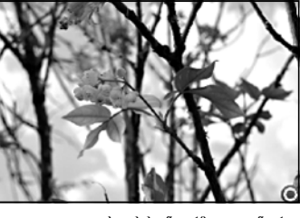
კახეთის საინფორმაციო ცენტრი

შეგახსენებთ, რომ ძლიერმა სტიქიამ 19 ივლისს კახეთი სტიქიური უბედურების ზონად აქცია. მთასამდე სახლის ქარიშხალმა სახურავი გადახადა. 40-დღე სოფელი მოსავალი მთლიანად განადგურდა.