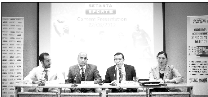
სეტანტა სპორტსი წარმომადგენლები პრესკონფერენციაზე

და „სეტანტა“ სპორტის გულშემატკვირებს სთავაზობენ: ინგლი-