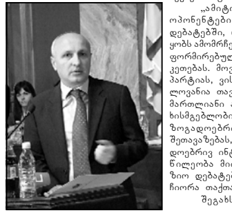
შეგახსენებთ, რომ სა-

„ამიტომ გამოიწვევით ოპონენტები წინასაარჩევნო დებატებში, რაც ხელს შეწყობს ამომრჩევლის მხრიდან ინფორმირებულ არჩევნის გაკეთებას. მოუწოდებთ ყველა პარტიას, ვისთვისაც მიიშვნელოვანია თავისუფალი და სამართლიანი არჩევნები, პასუხისმგებლობით მოუკიდონ საზოგადოებრივი მუხედების შეთავაზებას, ფართო საზოგადოებრივ ინტერესს და მონაწილეობა მიიღონ სატელევიზიო დებატებში“. — აღნიშნა ჩიორა თათუაშვილმა.