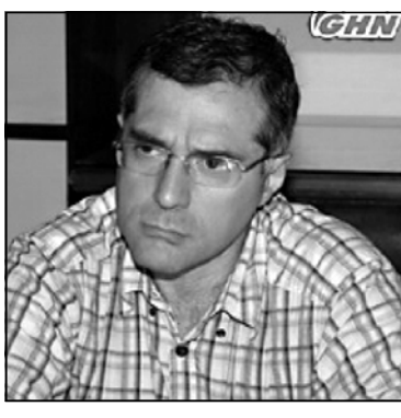
ნული პლატფორმის განმარტებით, შემოერთების ინვესტიციები „მასტერს“ სატელევიზიო ანტენების დაყვანების ფაქტი.

აღმოსავლეთ პარტნიორობის სამოქალაქო საზოგადოების ფორუმის საქართველოს ეროვნული პლატფორმა