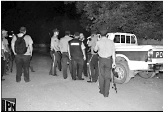
მარცხნივ — დროისთვის სტაბილურია, ამის შესახებ განაცხადის მინისტრმა ზურაბ ჭიაბერაშვილმა განაცხადა, რომელმაც დღეს დილით ლუფანურში კლინიკაში ის დაჭრილი სპეცრაზმელი მონაწილეა, რომელსაც დაჭრილი ფეხის არეში ოპერაცია ჩატარდა.

ლაფანურში მძევლობიდან გაათავისუფლებული 5 ახალგაზრდა დაციხვიდან გაათავისუფლეს. ამის შესახებ ჟურნალისტებს სოფლის მაცხოვრებლებმა განცხადეს. მათი თქმით, ქართველი ძალები მძევლებს სახლებში იმყოფებოდნენ. „უთუ ახალგაზრდა, რომლებიც ქართველმა სამართალდამცველებმა გაათავისუფლეს და დაკითხვაზე მყოფები, ამ დროისთვის სახლებში იმყოფებიან. მათი თქმით, ისინი მძევლებად 17-კაციან დაჯგუფებას ჰყავდა. დანარჩენ მძევლებზე არ საუბრობენ“ — განაცხადს სოფლის ერთერთმა მკვიდრმა. ნუხანდელმა ლამე სოფელ ლაფანურში მშვიდად ჩაიარა. დაახლოებით, 02:00 საათის შემდეგ სამხედრო მანქანების გადაადგილება დაფანურშიდან ლოპოტას სახლებში მიმართული ერთ შეიქმნილია, თუმცა დროს გარკვეული ინტერვალებით აღნიშნული მიმართულებით პოლიციის ე.წ. პიკეტის ტიპის ავტომობილები მიმართდნენ.