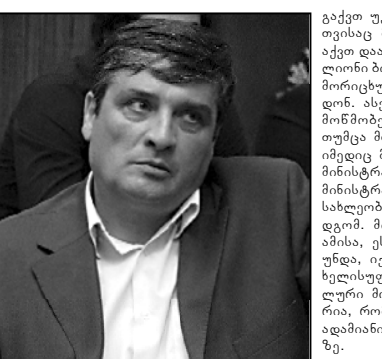
ხელისუფლება უკვე არჩევნების მეორე დღისთვის ემზადება