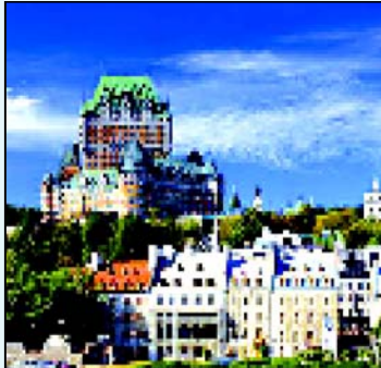
სუფლები, რომელიც ირანელი დიპლომატის სიტყვებით „სირიის ტერიტორიის რეჟიმის გაგენის ქვეშ იმყოფება“. ამასთან, ირანელმა დიპლომატმა დასძინა, რომ თირანი „ადეკვატურ პასუხს“ გასცემს კანადის ხელისუფლებას და დახურავს საკუთარ საელჩოს კანადაში.

კანადა ირანთან დიპლომატიური ურთიერთობა განაგრძობს. ოფიციალურმა კანადამ თირანში თავისი დიპლომატიური დაწესებულება დახურა და კანადაში მყოფი ყველა ირანელი დიპლომატი პურსონა ნონგრატად გამოაცხადა. კანადის საგარეო საქმეთა სამინისტრო ამ ნაბიჯის მიზეზად ირანის მიერ სირიის პრეზიდენტ ბაშარ ალ-ასადის რეჟიმისთვის დახმარების განხორციელება და ისრაელისადმი სამხედრო მუქარა, ასევე ირანის მიერ გაეროს რეზოლუციების შეუსრულებლობა დაასახელა. ირანელ დიპლომატებს კანადის ტერიტორიის დატოვებისთვის სთხოვეს დატოვება. ირანის საგარეო საქმეთა სამინისტროს სპეციალურმა წარმომადგენელმა გააკრიტიკა კანადის ხელ-