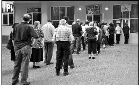
და აგრესიული იყვნენ და შურნალისებრი ურთიერთობის თავს არიდებდნენ.

ნაქალაქო აბრეშულად ნაციონალი ქალაქი იქცეოდა