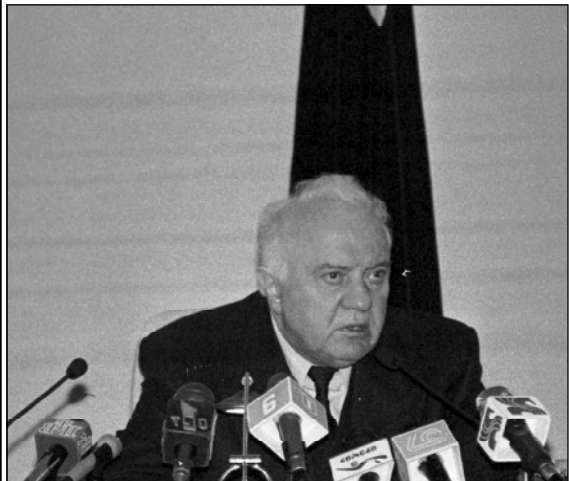
Большую часть интервью я даю в связи с 10-й годовщиной этой трагедии, Президент Грузии Эдуард Шеварднадзе в интервью

Даю оценку событиям 9 апреля в связи с 10-й годовщиной этой трагедии, Президент Грузии Эдуард Шеварднадзе в интервью