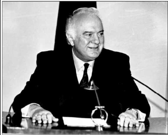
Грузия в Европе место и роль европейского государства

принятия Грузии в Совет Европы, Президент страны Эдуард Шеварднадзе в интервью Национальному радио отметил, что главное все же состоит в том, что этот беспрецедентный визит в США, как и происшедшее в Страсбурге событие, окончательно подтвердили: Грузия, как независимое, демократическое государ-