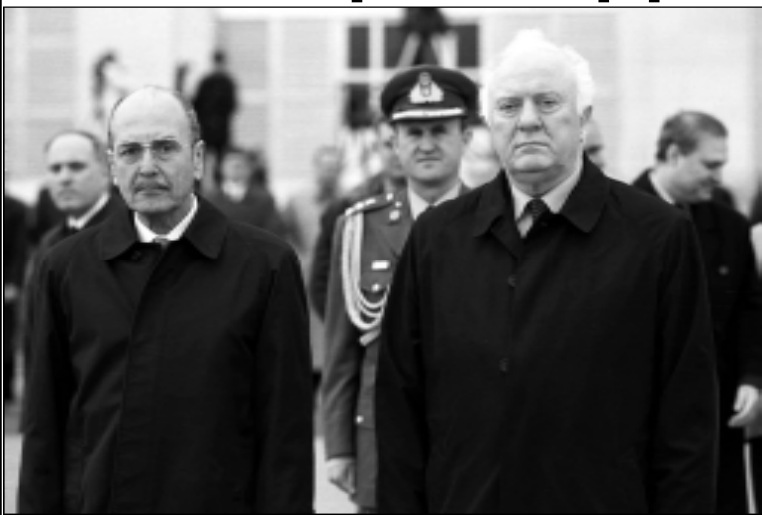
В ТБИЛИСИ ГРЕЦКИЙ ПРЕЗИДЕНТ КОНСТАНТИНОС СТЕФАНОПУЛОС

В летопись традиционных дружеских отношений Грузии и Греческой Республики вписана еще одна светлая страница: 9