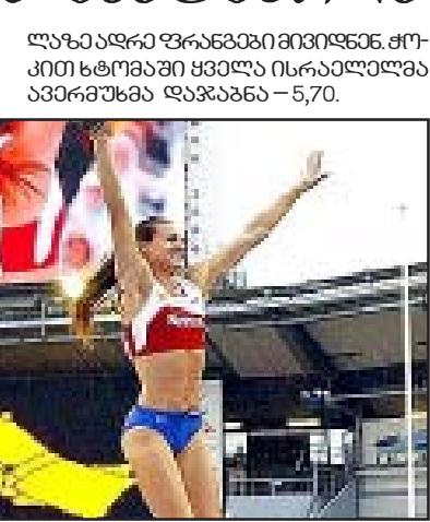
ლაზარე ფრანგები მივიდნენ. მქონე ტოპიში ყველა ისრაელიელმა...