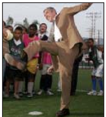
შეიქმება იმედი, პრემიერი იქნება ნამდვილად გაუმართლებელი...