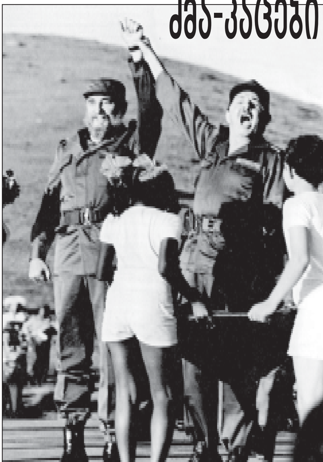
ამ დღეებში კუბის რევოლუციის ლიდერს კომანდანტო ფიდელ კასტროს 80 წელი შეუსრულდა. უკვე თითქმის ნახევარი საუკუნეა (1959 წლიდან) ფიდელს ხელიდან არ გაუშვია ქალაქფლობა...