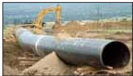
REGNUM 14 აგვისტო