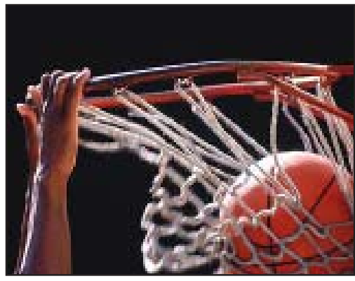
მომრე ეტაპი უფრო მძიმე და ფიციკალი ორთაბრძოლა გველის...