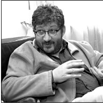
ტაკლი, ეს არის უფრო ჩვენი მიძღვნა კოტე მარჯანიშვილისადმი.

მარჯანიშვილის თეატრის ხელმძღვანელი ლევან ნულაძე თეატრის მოქცევის ხარისხსა და პირობებს განიხილა. 24 თქვენი მარჯანიშვილის თეატრის დიდ სცენაზე პრემიერა. ლევან ნულაძე დიმიტრი ხვინიასვილიან ერთად სპექტაკლს დაგმოს, რომლის სახელწოდებაც „კოტე მარჯანიშვილია“. კოტე მარჯანიშვილის სახელობის თეატრი წელს თანამედროვე თეატრის წიგნს იტყობს. წელს თეატრმა მსუხუბრილი ზეინი გახსნა და თან თეატრის დამაარსებლის კოტე მარჯანიშვილის 140 წლის თარიღსაც შეიძინა. სწორედ ამიტომ მარჯანიშვილის თეატრში მიღგაწე რეჟისორებმა სპექტაკლი ამ თეატრის დამაარსებელზე გურომ ბათიასვილის პიესის მიხედვით დადგეს.