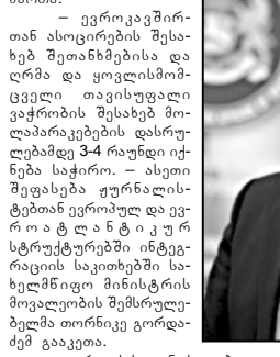
გურამი ვიანდინი: ამჟამად საქართველოში ძალაუფლებს გადაცემის პროცესი მიმდინარეობს. ასევე ვეცადე ქუთაისში.

ევროკავშირის წარმომადგენლებთან ასოციაციის შესახებ მოლაპარაკებებში მონაწილეობა მიიღო.