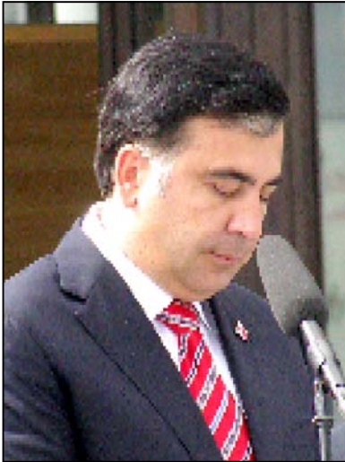
რა შესთავაზა ივანიშვილმა პრეზიდენტს