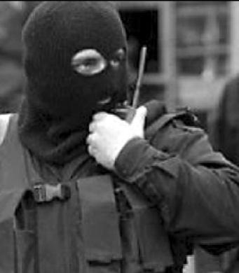
ტერისებული აღნიშნული საქმის შედეგები.

— იმ ჯგუფში ვინ შედიოდა, რომელი ჯგუფი საავადმყოფოში მივიდა და უშუალოდ იმ მომენტში ვინ იძლეოდა ბრძანებებს?