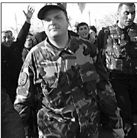
რა ბრალდებებს უყენებს აფრასიძის დედა ყოფილ შს მინისტრს

— ვინ აჩვენა? — ამათ. დაკითხვებზე რომ ჰყავდათ შვიდი, იქ შეუტანია ერთ-ერთი პოლიციელი თუ გამოძიებელი. შვიდასთვის უკითხავს, ხომ არ გეცნობო. შვიდნი, რა თქმა უნდა, იცნო ომების ნიუბები და ძალიან გამწარდა. იმან კი ნიშნის მოგებით უთხრა თურმე, თქვენი იყო, მაგრამ ახლა ჩვენიყო.