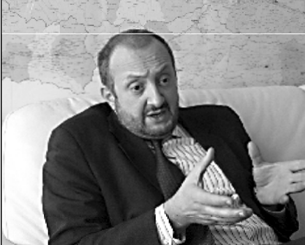
პასუხისმგებლობას კერძო სკოლის მიმართაც ვერ მოვხსნით

– მოდელი, რომელიც იყო შემუშავებული ლომიას დროს, რომ აქცენტს გაკეთდეს დემოკრატიზაციაზე, ხელისუფლება აღმოჩნდა. ამ მოდელის ძირითადი ინიციატივა, რომ მოხდეს დეცენტრალიზაცია სწორია.