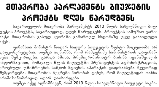
რისი იქნება იმისათვის, რათა კოალიცია „ქართველი ოცენების“ დაპირებების შესრულება ეტაპობრივად სწორედ 2013 წლიდან დაიწყოს.